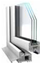
Kunststoff- Fenster VEKA MD 82